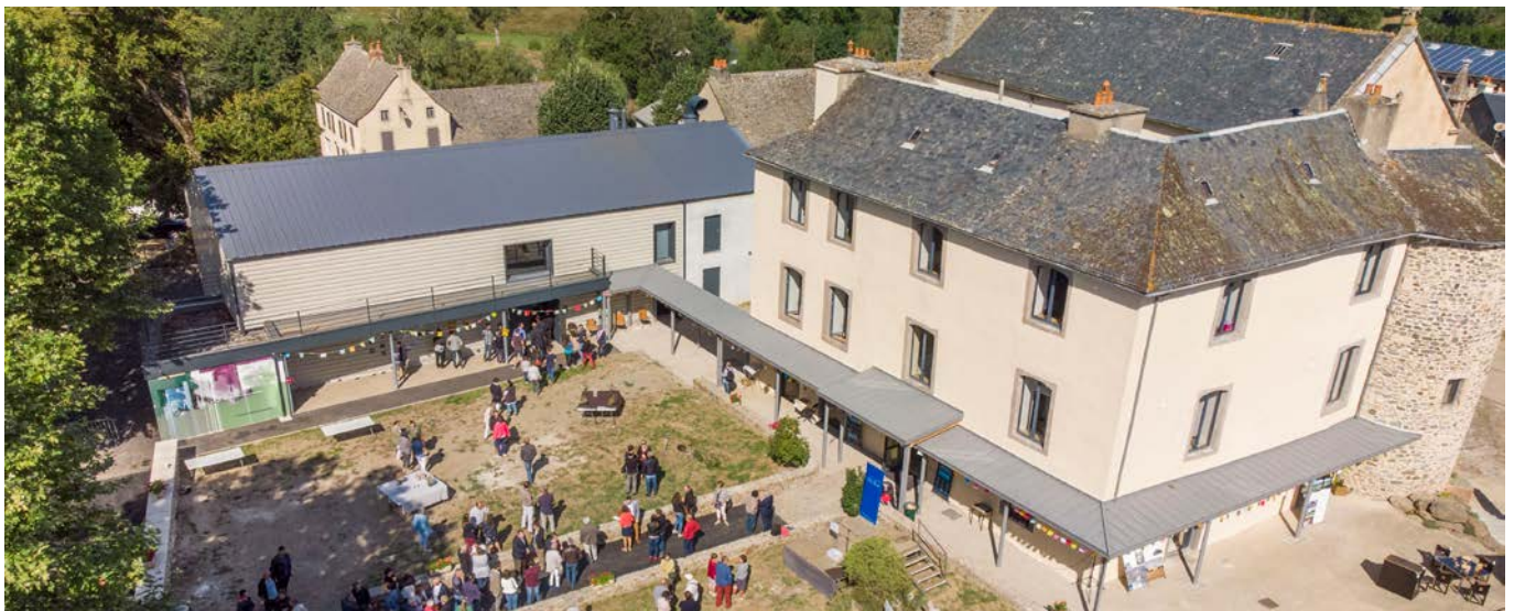
Inauguration du Jardin d'Arvieu en septembre 2019